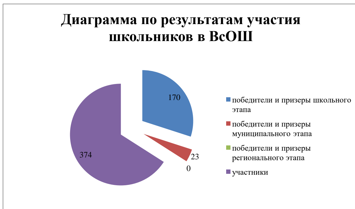
Диаграмма по результатам участия школьников во ВсОШ